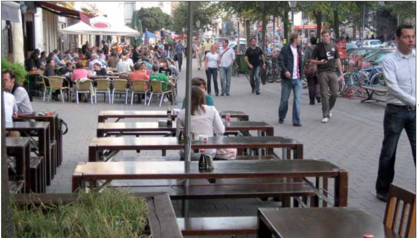
Auf der Partymeile: Das Schulterblatt als »Schanz-Elysée«

Gerade ist eine neue BürgerInneninitiative gegründet worden, die sich gegen die überhandnehmende Außengastronomie in der Susannenstraße im Schanzenviertel wehrt, nur einige Hundert Meter entfernt engagiert sich seit Sommer die »Anwohnergemeinschaft Neuer Pferdemarkt« erst gegen ein weiteres Außencafé und nun für den Erhalt einer kleinen Grün- und Erholungsfläche am Neuen Pferdemarkt/Beim Grünen Jäger. Immer öfter macht sich in den Szenevierteln Widerstand gegen die Ummodellung Hamburgs zu einer markt- und renditegerechten, auf Leuchttürme, Amüsierpublikum und Touristenmassen abzielenden Metropole bemerkbar, die sich neuerdings auch noch als »Shopping-Hauptstadt« mit »Night-Shopping am Freitag, fantasievoller Performancekunst am Samstag und einem verkaufsoffenen Sonntag« geriert (so die 116-seitige Broschüre zu den »Hamburg Shopping Days 2009« vom 6. bis 8. November).