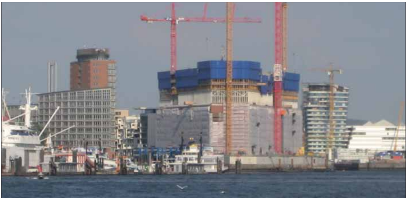
Elbphilharmonie: Hier wird Geld versenkt!

Gegen viele Projekte des Bezirks Mitte habe ich in den vergangenen anderthalb Jahren (auch in den BürgerInnenbriefen) Widerspruch erhoben – z.B. gegen die intransparenten Shared-Space-Planungen und die überflüssige Pferde-Kombi-bahn auf dem Gelände der Horner Rennbahn. Jetzt haben SPD und GAL Mitte selbst Widerspruch gegen den vom Senat angewiesenen Umzug des Bezirksamts vom Klosterwall in die Hafencity angemeldet. Begründet wird er nicht zuletzt damit, dass der Quadratmeterpreis für die Büroräume von neun auf 15 Euro ansteigen würde. Ich begrüße diesen Beschluss, ist er doch Sand ins Getriebe des grün-schwarzen Senats, der sich diese Umsetzung des Bezirksamtes nur deswegen auf die Fahnen geschrieben hat, damit die Hafencity nicht zur traurigen Investitionsruine mit lauter leerstehenden Gebäuden wird.