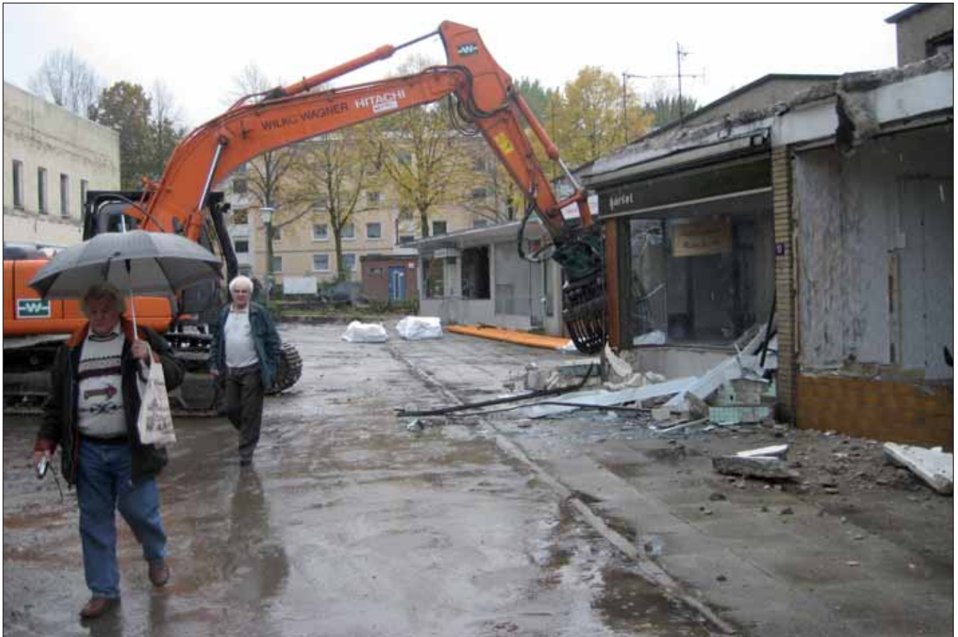
Frei gegeben zum Abriss: der Rothenburgsorter Marktplatz

So viele Kaschmirmäntel und Trenchcoats hatte der Rothenburgsorter Marktplatz noch nie gesehen: Am frühen Nachmittag des 28. Oktober gaben sich eine Schar Damen und Herren Investorenvertreter und die komplette höhere Bezirksamts-hierarchie im schönsten Schmuddelwetter ein Stelldichein auf dem traurigen Platz im Herzen von Rothenburgsort. Man hatte etwas zu feiern.