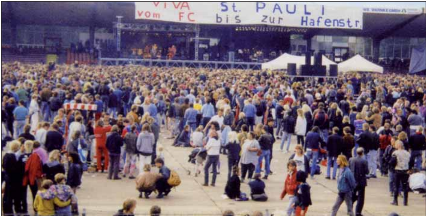
Mehr als Fußball: Der Kiez feiert 1991 im Stadion »Viva St. Pauli«

Beim Kult-Club FC St. Pauli sind Sport und Stadtteil eng miteinander verknüpft. Deshalb diesmal Lektüretipps aus Anlass des bevorstehenden 100-jährigen Jubiläums im Jahr 2010.