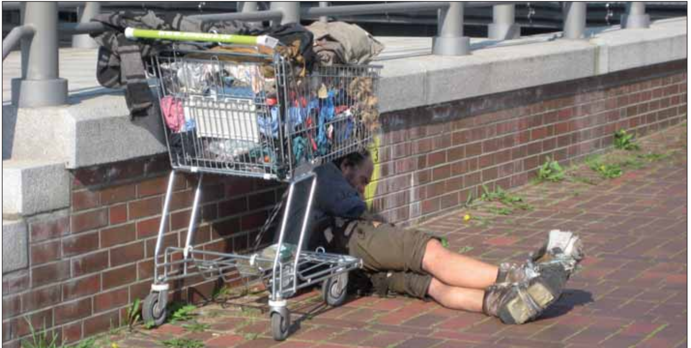
Muss im Mittelpunkt stehen: die Lösung der sozialen Probleme

hende Ausblenden der Auswirkungen von Aufwertung und Verdrängung (Gentrifizierung). Die Benachteiligung von Stadtteilen insbesondere in den Großsiedlungen am Standrand anzugehen und zugleich die innerstädtischen Aufwertungsprozesse zu ignorieren, bedeutet, die Entwicklung in arme und reiche Stadtteile (Segregation = Trennung, Spaltung) eher noch zu verfestigen.