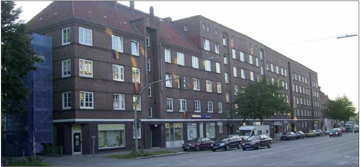
Auch immer teurer: Mietwohnungen in Hamburg-Horn

eigenen Problemlage und Ausgrenzung ist, wie all die Bürgerinitiativen beweisen, schon lange am schwinden.