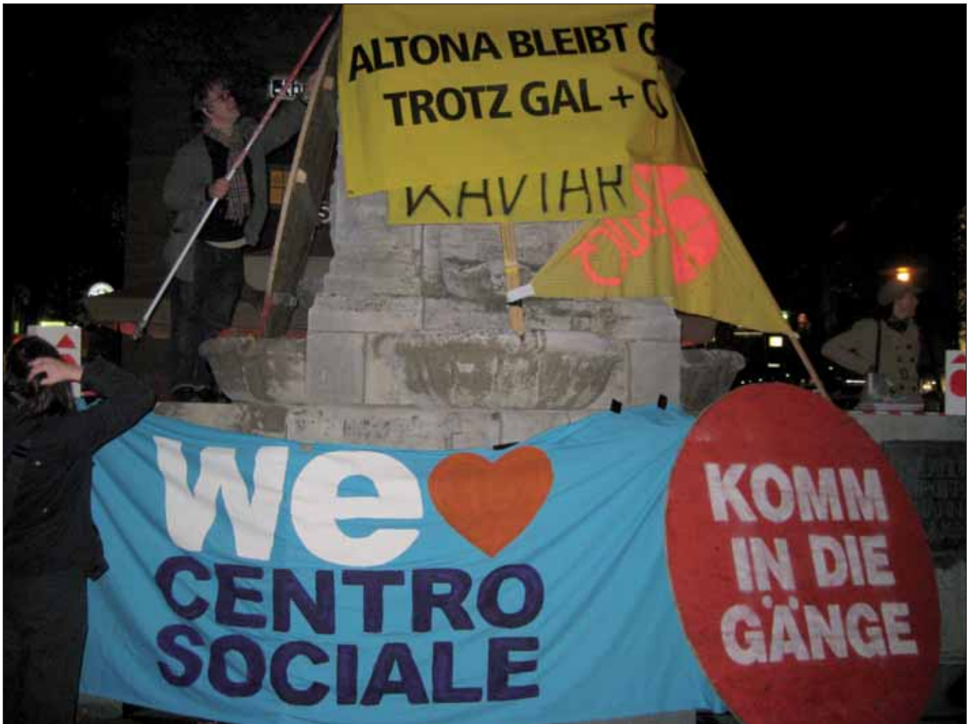
Am 11.11.2009 vor dem Elbphilharmonie-Café an der Mönckebergstraße

Ein Blick in die Zeitungen der vergangenen Wochen veranschaulicht, dass offenbar eine neue sozial- und stadtentwicklungspolitisch motivierte Bewegung entstanden ist. In der »Zeit« vom 19.11. ist in einem großen Artikel vom »Hamburg-Wunder: Eine Stadt wandelt ihre Gesinnung« die Rede, die »taz« vom 21./22.11. titelt »Wem gehören die Städte?« und widmet auf der Schwerpunktseite Hamburg eine ganze Seite unter der Überschrift »In die Gänge gekommen«. Das »Abendblatt« räumt in der Ausgabe vom gleichen Wochenende dem »Kampf um das Leben in der Stadt – nirgendwo tobt er so heftig wie in Hamburg« mit einem doppelseitigen Dossier ebenfalls reichlich Platz ein.