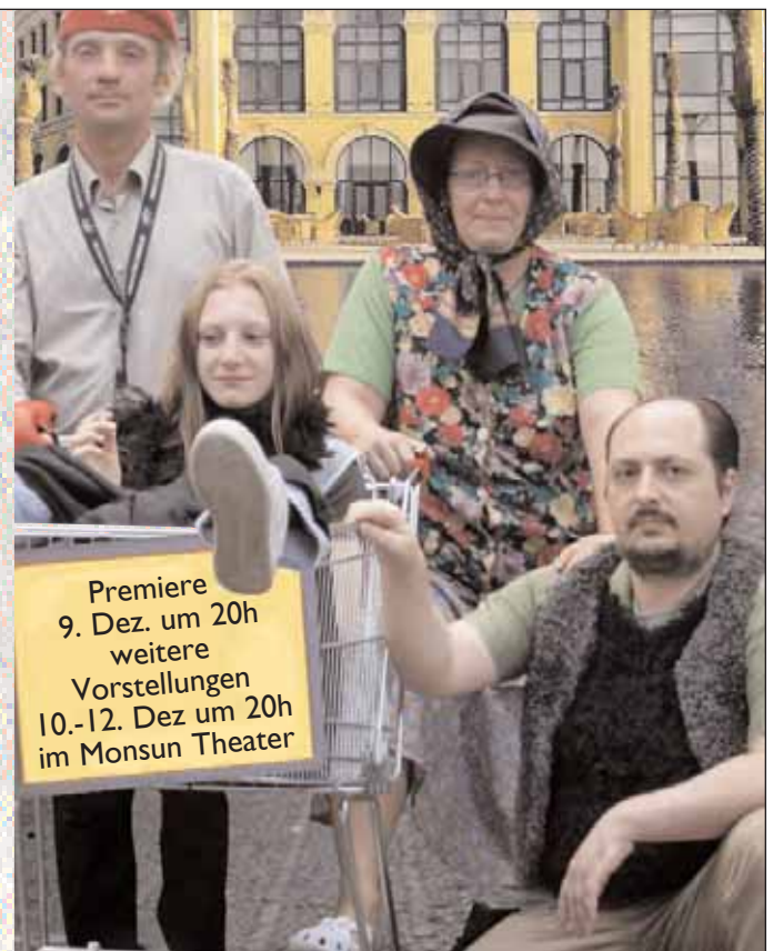
Aus der Programmankündigung des Monsun-Theaters

Der Dezember ist traditionell der Monat der Weihnachtsmärchen für Kinder, und so hat sich auch das Monsun-Theater in der Friedensallee 20 ein Grimmsches Werk vorgenommen, geeignet allerdings mehr für Erwachsene. Das Stück frei nach einer Idee von Iring Fetscher trägt den schönen Titel »Die Bremer Stadtmusikanten oder: Die erste alternative Hausbesetzung«. Das altbekannte Märchen wird auf die Jetztzeit übertragen, und die vier Stadtmusikanten werden von DarstellerInnen gegeben, die ohne Arbeit, ohne Wohnung und ohne Zukunft zu sein scheinen. So machen sich die vier auf den Weg, irgendwo unterzukommen, und finden schließlich ein Obdach in einer »Villa reicher Unternehmer, die an dem Elend anderer ihr Geld verdienen«. In einer gemeinsamen Aktion jagen sie den eine neue Gaunerei ausheckenden Unternehmern Angst ein und veranlassen sie zur Flucht – und zur Erfahrung, was Obdachlosigkeit bedeutet. Premiere ist am 9. Dezember , weitere Aufführungen sind für den 10., 11., und 12. Dezember jeweils um 20 Uhr angesetzt. Der Eintritt beträgt 15/12 Euro.