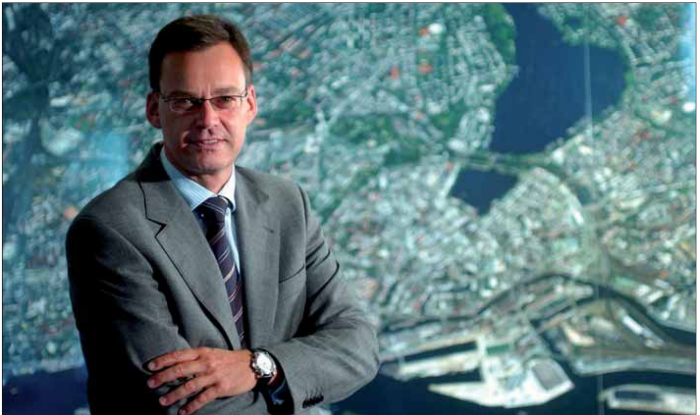
Lautes Pfeifen im Wald: Der Wirtschaftssenator »macht Mut für das nächste Jahr«

Es gibt sie noch – die Schönwetterpropheten. Beispielsweise den Hamburger Wirtschaftssenator Axel Gedaschko: Durch die kluge Haushalts- und Finanzpolitik des schwarz-grünen Senats werde »passgenau die sich langsam abzeichnende konjunkturelle Erholung gestützt«. Der Hamburger Senat werde trotz aller Sparvorgaben nicht bei den geplanten Investitionen kürzen oder streichen. Positiv sei zudem zu vermelden, dass der Einzelhandel in Hamburg aktuell überdurchschnittlich gut dastehe und auch die Situation auf dem Arbeitsmarkt besser sei als im Bund.