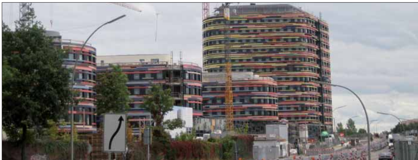
Auch ein IBA-Projekt: das neue BSU-Gebäude (M. Joho)

Ende März wurde die Internationale Bauausstellung (IBA) in Wilhelmsburg eröffnet. An dieser Stelle möchte ich eine erste Einschätzung geben. Die IBA hat sich auf ihre Fahnen geschrieben, die Stadt der Zukunft zu repräsentieren. Innere Entwicklung eines Stadtteils und Stärkung der Vielfalt waren ebenso Schlagworte wie das Versprechen des Bürgermeisters Olaf Scholz, hier solle eine Aufwertung ohne Verdrängung stattfinden.