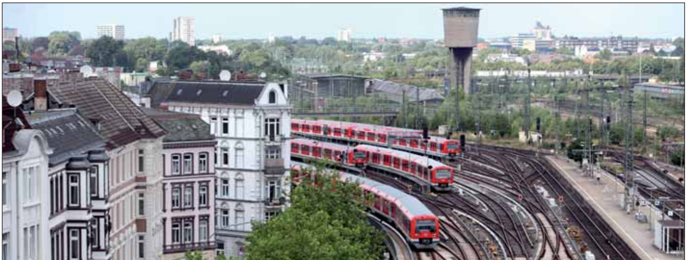
Im Fokus: Bahnhof Altona, 2009

Eines der größten Wohnungsbauvorhaben des Senats soll in Altona realisiert werden. Auf dem teilweise schon aufgegebenen Bahngelände der so genannten Neuen Mitte Altona sollen insgesamt 3.500 Wohnungen entstehen. Im 1. Bauabschnitt, für den jetzt der Bebauungsplan entwickelt wird, sind 1.600 Wohnungen geplant. Am 20. Februar fand eine öffentliche Plandiskussion vor Ort statt.