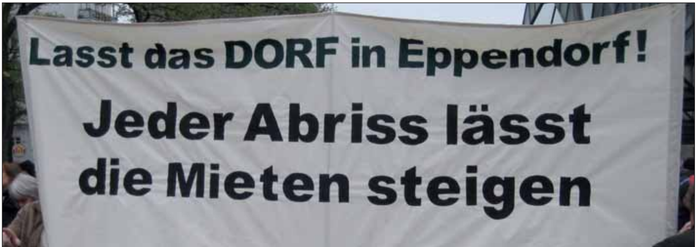
Nicht unter Ausschluss der Öffentlichkeit! (M. Joho)

Eine ungehaltene Bürgerschafts-Rede vom Tim Golke