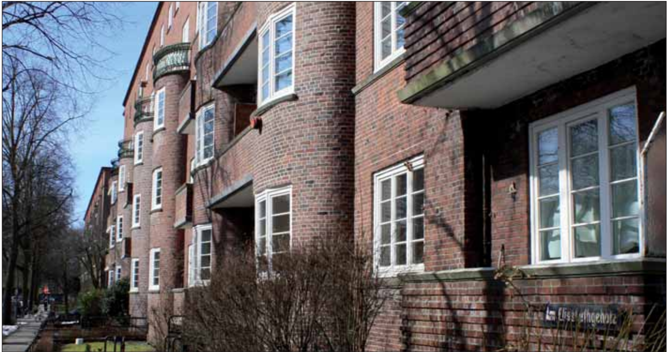
Backsteindytle auf Zeit? Elisabethgehölz im März 2013

Seit dem 28. Februar weiß die Bezirksfraktion Mitte der LINKEN, dass die ELISA-Häuser in Hamburg-Hamm abgerissen werden und stattdessen teurere Neubauten mit anderen Wohnungsschnitten errichtet werden sollen (natürlich unter Inanspruchnahme erheblicher öffentlicher Mittel, obwohl dadurch keine einzige Wohnung neu entsteht!). Grundlage für diese Maßnahme ist ein neues Gutachten, das weder den KommunalpolitikerInnen noch den BewohnerInnen vorliegt. Wie uns die Initiative »Rettet Elisa« mitteilte, habe die Vereinigte Hamburgische Wohnungsbaugenossenschaft (vhw) einen neuen Statiker eingestellt, der der Oberbaudirektion Kosten von 3.000 Euro/qm für eine Sanierung der Gebäude vorgelegt hat. Es heißt, wenn die Wohnungszuschnitte verändert würden, sei die Statik der Gebäude nicht gesichert, dabei will die Initiative zur Rettung der historischen Backsteingebäude eine Sanierung ohne Änderung der Zuschnitte durchsetzen.