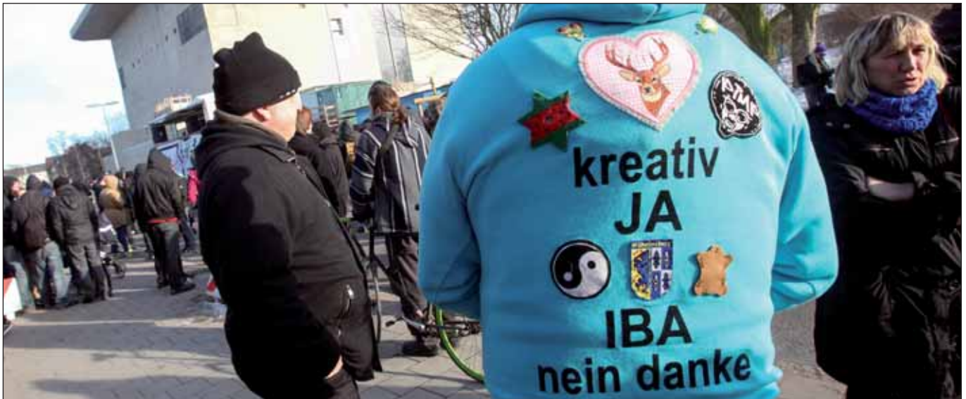
Demo gegen die IBA, 23.3.2013