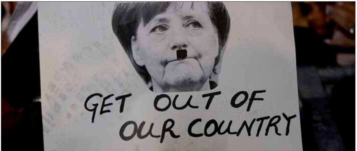
Protest in Nicosia, Zypern, 19.3.2013

»Das Schicksal zyprischer Kontoninhaber wurde in Berlin besiegelt.« (Financial Times)