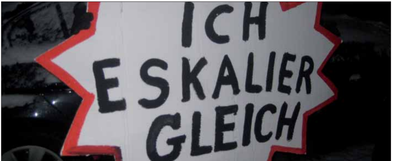
Wenn Beteiligung scheitert...

Unter diesem Motto findet am Samstag, den 27. April, ein ganztägiger »Aktionstag« des Netzwerks Hamburger Stadtteilbeiräte statt. Im Mittelpunkt steht der Austausch von Menschen, die in ihren Vierteln teilweise schon lange engagiert sind, um dort Verbesserungen durchzusetzen und der Politik und Verwaltung nicht nur auf die Finger zu sehen, sondern auch Forderungen geltend zu machen. Kommunale Demokratie von unten eben, die eigentlich ein Erfordernis unserer Metropolengesellschaft im 21. Jahrhundert ist. Doch der SPD-Senat blockiert eine Verstetigung, geschweige denn eine