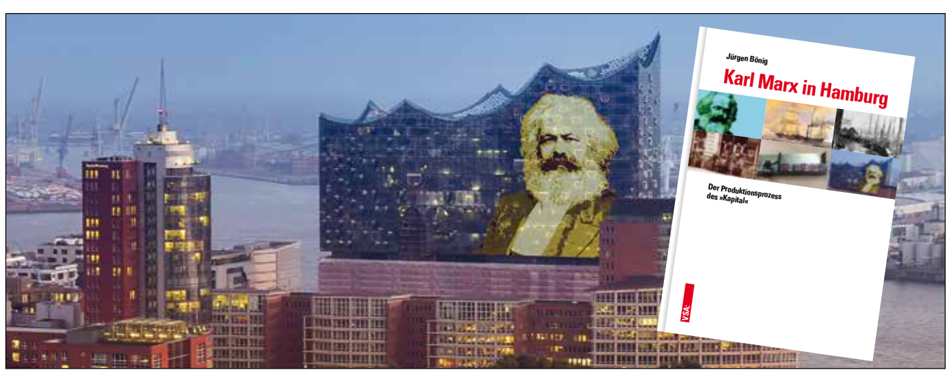
Abbildung und Buchcover: VSA: Verlag

150 Jahre ist es her, dass in einem Hamburger Verlag der erste Band des Hauptwerks von Karl Marx, »Das Kapital«, erschien. Ein schöner und wieder einmal aktueller Anlass, der »Kritik der politischen Ökonomie« und seinem Verfasser die gebührende Aufmerksamkeit zuteil werden zu lassen. Hierzu weisen wir auf eine Auswahl von Veranstaltungen hin: