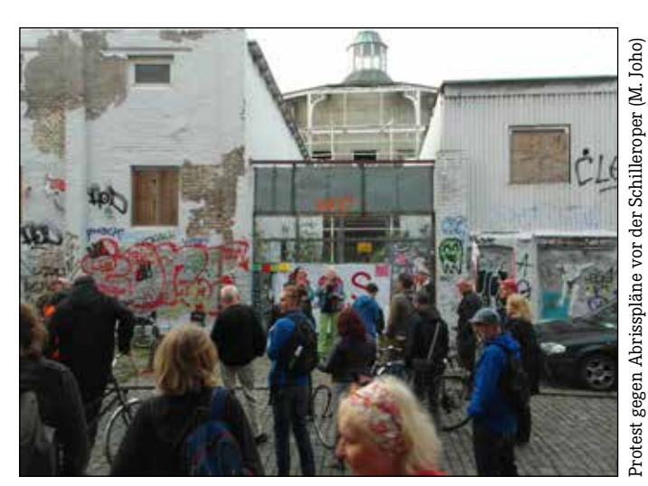
Schichten der Bevölkerung mit günstigem Wohnraum. Kurz gesagt: Keine Rendite mit der Miete!

Gemeinsam mit unserer Bundestagsfraktion streiten wir für eine neue Gemeinnützigkeit in der Wohnungswirtschaft. Wohnungen sollen nicht mehr als lukrative Anlageobjekte für InvestorInnen dienen, sondern der Versorgung breiter