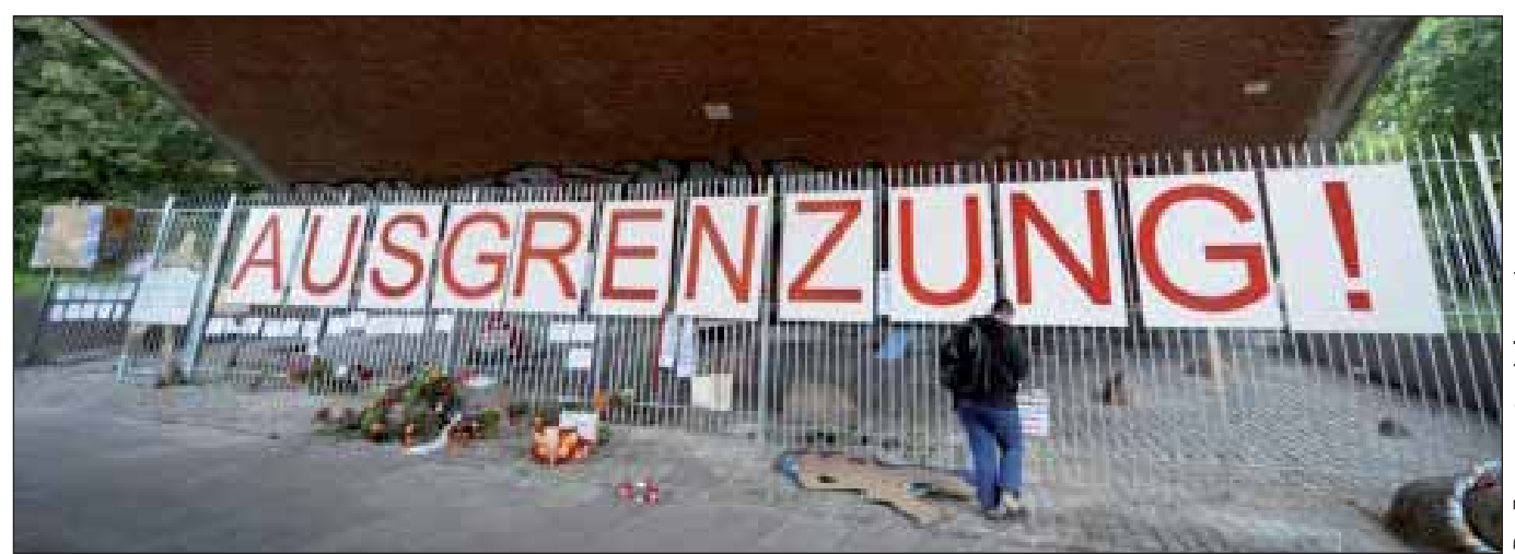
er Zaun musste wieder weş

Öffentlichkeit gewandt (siehe Kasten), in der er sich eindeutig gegen die Schreiberschen Pläne der Verdrängung von in Not geratenen Menschen ausspricht.