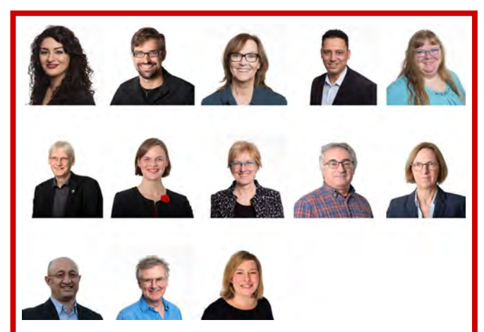
Wer die 13 Abgeordneten der neuen Fraktion DIE LINKE in der Hamburgischen Bürgerschaft sind und wer wofür zuständig ist, ist hier in Wort und Bild zu finden: www.linksfraktion-hamburg.de/fraktion/

und einen Durchschnittsabschluss erhalten, der ihre erbrachten Leistungen der letzten Schuljahre berücksichtigt (www.buergerschaft-hh.de/parldok/vorgang/63918).