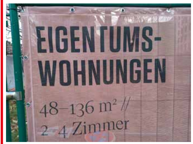
Überall neue Eigentumswohnungen, hier Werbung für ein Großprojekt an der Hamburger Straße

hat 2005 als erste deutsche Stadt eine Fachabteilung dafür gegründet. Jede dritte Wohnung in der Main-Metropole entsteht mittlerweile auf ehemaligen Büroflächen. Spitzenreiter des vergangenen Jahrzehnts war Berlin, auf das ein Drittel aller bundesweiten Umwandlungen entfiel. Wie ein Kurzgutachten der Arbeitsgemeinschaft für zeitgemäßes Bauen (ARGE) in Kiel gezeigt hat, rechnet sich das Umdenken: Die reinen Umbaukosten pro¾ Quadratmeter – abzüglich des Grundstücks- oder Rohbaupreises - liegen im Vergleich zum Neubau bei knapp 40 Prozent« (https:// email.t-online.de/em?wdycf=www.t-online.de#f=IN-BOX&m=11839851538777010&method=showReadmail). Die H&K-Ausgaben werden zum Preis von 2,20 Euro von 530 Verkäufer:innen in ganz Hamburg angeboten.