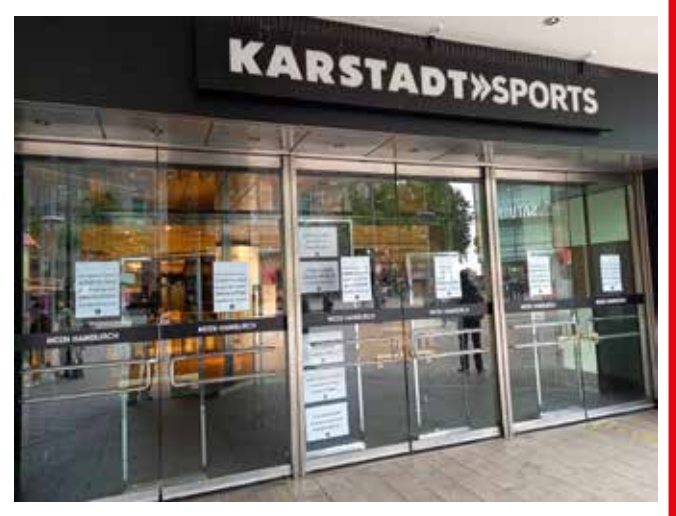
Leerstand seit mehr als anderthalb Jahren

stadt Sport« am Eingang der Mönckebergstraße ab demnächst für kreative Zwischennutzung zur Verfügung steht. Ganze, halbe oder viertel Geschosse von ca. 250 bis 1.200 Quadratmeter können von Juni/Juli bis Dezember 2022 angemietet werden. Der Eigenanteil der Raumkosten liegt monatlich bei 1,50 Euro je Quadratmeter, weiteres Geld kommt aus dem zurzeit noch bis Ende 2022 befristeten Förderprogramm »Frei Fläche: Raum für kreative Zwischennutzung«. Mehr Infos unter https://kreativgesellschaft.org/raum/ frei_flache-raum-fur-kreative-zwischennutzung/. Weitere Flächen, die unter diesem Förderprogramm rangieren, gibt es hier einzusehen: https://kreativgesellschaft.org/raum/frei_flaeche-die-plattform/. Es lässt sich darüber spekulieren, was Stadt und Eigentümer:in mit diesem Schritt beabsichtigen, auf jeden Fall bietet die Zwischennutzung eine Chance, zu zeigen, was die Menschen in diesem Gebäude zukünftig gerne hätten.