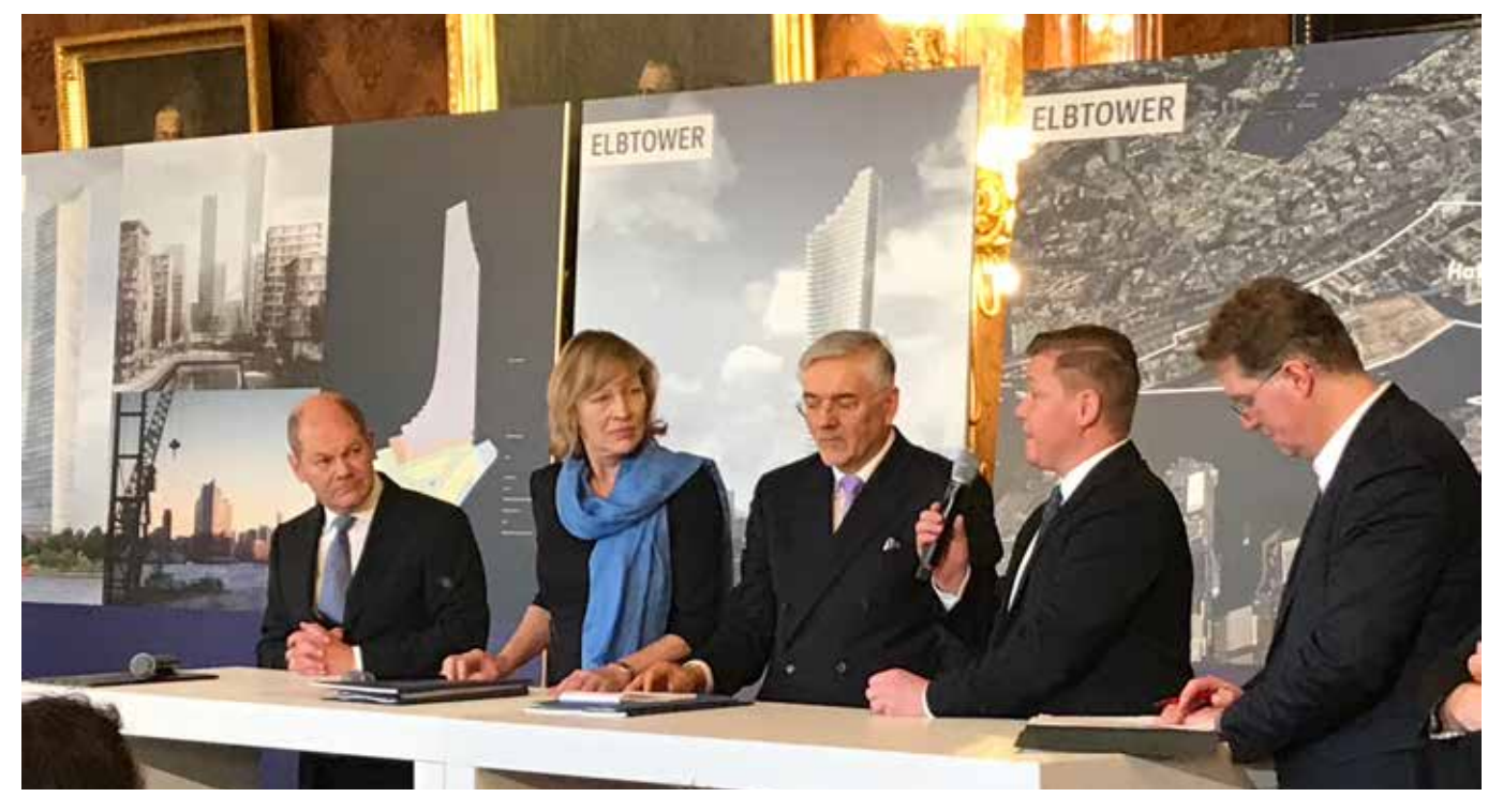
Kurz vor seinem Abgang nach Berlin kürt Olaf Scholz am 8. Februar 2018 den Wettbewerbssieger SIGNA mit seinem Elbtower

Für mich geht es bei der Akteneinsicht um solche Fragen wie: Wer wollte und will unbedingt den Olaf-Scholz-Gedenkturm haben? Weshalb wurde nicht der Höchstbietende ausgewählt? Weshalb klingeln keine Alarmglocken, wenn es um einen Investor wie René Benko geht, dessen Firmen im Steuerparadies Luxemburg sitzen, der in einem Steuerverfahren verurteilt wurde und gegen den laut »Der Spiegel« aktuell Ermittlungen wegen Bestechung laufen? Was ist mit der großartigen Publikumsnutzung, die immer wieder versprochen wurde? Wieso muss die 30-prozentige Vermietungsquote nicht direkt gegenüber dem Senat nachgewiesen? Wurde das EU-Beihilferecht missachtet?