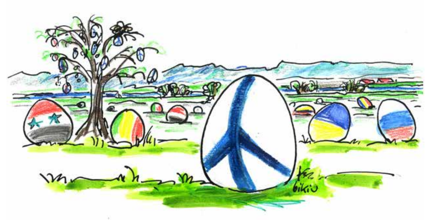
Ein nachträglicher Gruß zu den österlichen Feiertagen (Zeichnung: Birgit Kiupel)