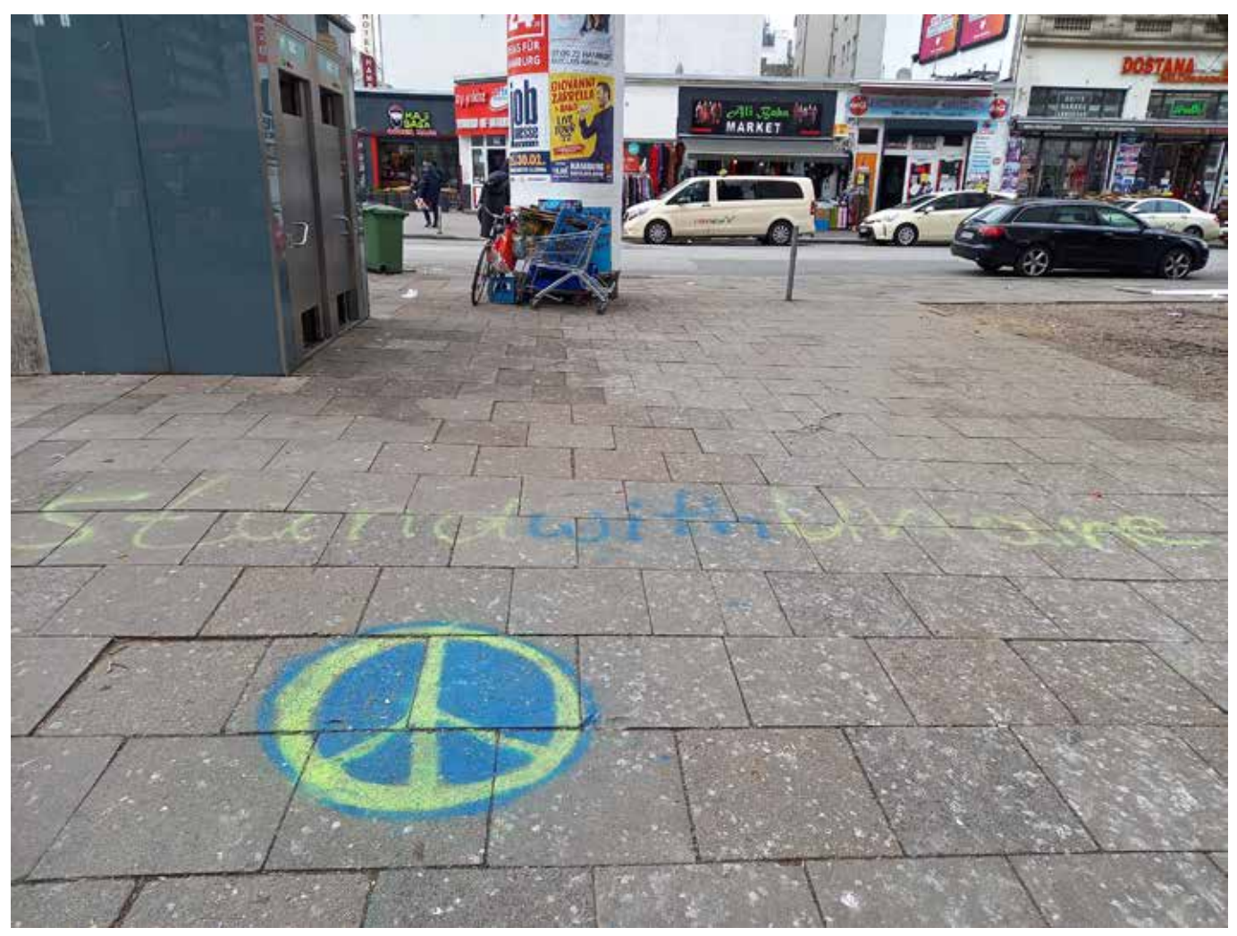
Friedensbekenntnisse wider die russische Intervention in der Ukraine

Putin dazu bewegen könnte, möglichst schnell in Friedensverhandlungen einzusteigen, die nicht die totale Zerstörung und/oder Übernahme der Ukraine zur Voraussetzung haben? Aus meiner Sicht lassen sich die Sinnhaftigkeit und der Wert von Solidaritätsaktionen, Sanktionen, Waffenlieferungen und NATO-Aufrüstung nur vor genau diesem Hintergrund beurteilen. Ein Versuch in zehn Thesen und einer Aufforderung: