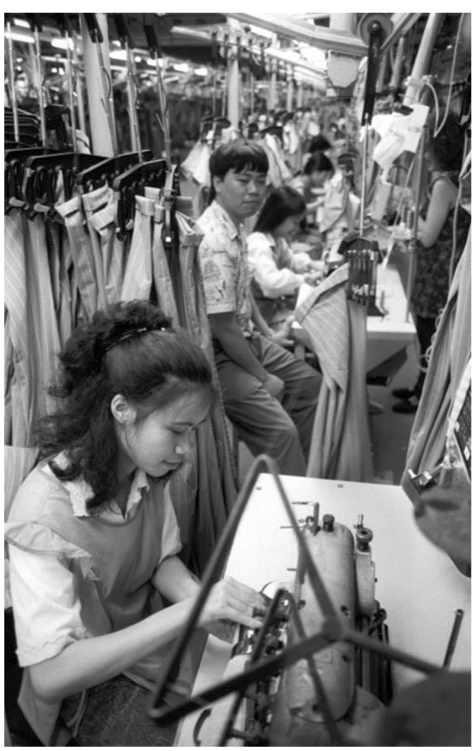
Vietnamesische Näherinnen in der DDR 1990

Aber auch aus Hamburg gab es damals Widerstand gegen die rassistische Mobilisierung, Menschen fuhren nach Rostock und beteiligten sich an der »Verteidigung« des Sonnenblumenhauses. Hieran wollen wir anknüpfen und fahren gemein-