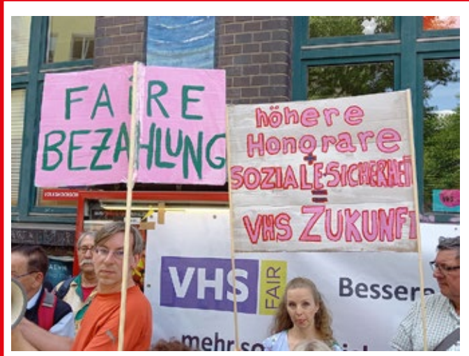
Auf der Kundgebung am 29. Juni

Lehrenden alleine in den Sprach- und Integrationskursen und nicht zuletzt die Kundgebung gibt es unter www.gew-hamburg.de/mitmachen/fachgruppen/erwachsenenbildung. Grundlegende Informationen über die Situation in der Weiterbildung hat die Linksfraktion zuletzt mittels einer Großen Anfrage Ende Mai 2022 in Erfahrung gebracht. Die betreffende Drucksache 22/8169 gibt es hier: www.buergerschaft-hh.de/ parldok/dokument/79802/arbeitsbedingungen_und_ das_engagement_der_regierungskoalition_in_der_ weiterbildung.pdf.