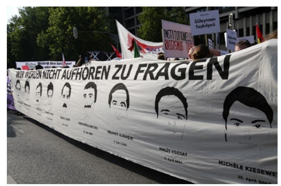
»Kein Schlussstrich« – Demonstration zur Urteilsverkündigung im NSU-Prozess am 11. Juli 2018 in München

Anfang September erscheint eine neue Broschüre der Linksfraktion, der Titel: »Der NSU-Komplex in Hamburg – Das Recht auf Aufklärung verjährt nicht«.