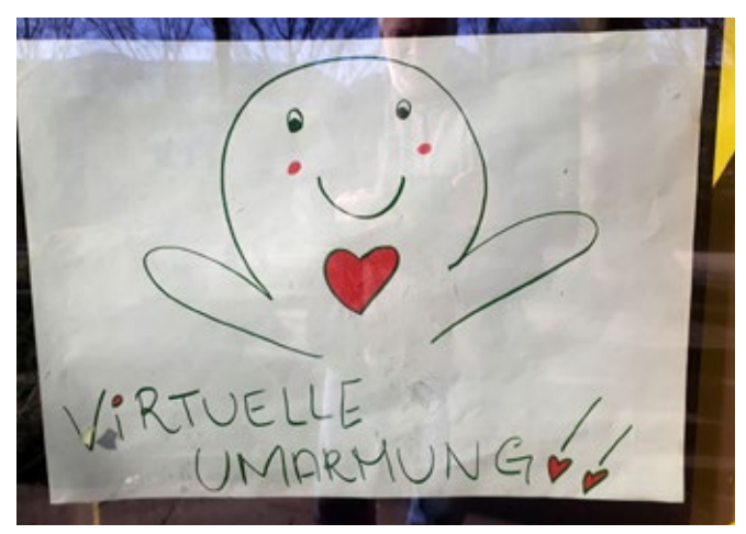
Impressionen aus dem Frühjahr 2020

Die Auswirkungen eben dieser Politik auf die Kinder und Jugendlichen sind drastisch. Die Copsy-Studie des UKE¹ kann auch in der dritten Befragungsrunde nicht mit Befunden aufwarten, die Anlass zum Aufatmen geben. Danach sind die Kinder und Jugendlichen weiterhin hochgradig emotional und psychisch belastet. Auch hier stellt das UKE fest, dass ökonomisch benachteiligte Familien »besonders betroffen« sind. Die Belastungen haben sich »auf hohem Niveau stabilisiert«. Die Auswirkungen der Coronapandemie und der Eindämmungspolitik werden durch die sozioökonomische Ungleichheit verstärkt. Es ist kaum anzunehmen, dass sich mit dem Auslaufen der Sondermittel des Bundes Ende 2022 daran etwas geändert haben wird. Die immensen und massiven Folgen der Pandemie auf die physische wie psychische Gesundheit der Schüler:innen werden noch Jahre nachwirken.