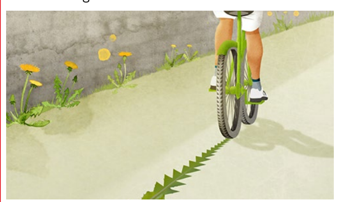
Jeder Kilometer zählt (von der Website www.stadtradeln.de/home)

»STADTRADELN ist ein bundesweiter Wettbewerb, bei dem es darum geht, 21 Tage lang möglichst viele Alltagswege klimafreundlich mit dem Fahrrad zurückzulegen«, heißt es auf der von öffentlichen und privaten Institutionen getragenen Initiative. »Jeder Kilometer zählt - erst recht wenn du ihn sonst mit dem Auto zurückgelegt hättest« (www.stadtradeln.de/home). Auch in Hamburg wird die Aktion – insbesondere vom »Allgemeinen Deutschen Fahrrad-Club« (ADFC) – gepusht. Vom 1. bis 21. September sollen möglichst viele Kilometer auf dem Fahrrad zurückgelegt werden. Dafür ist es nötig, sich auf stadtradeln.de/hamburg registrieren zu lassen. Dann heißt es, einem Team beizutreten oder ein neues zu gründen. Die geradelten Kilometer werden per Stadtradel-App aufgezeichnet oder ggfs. auch nachgetragen. Mehr dazu unter www. stadtradeln.de/hamburg. Bis zum 22. August haben sich übrigens bereits 639 Teams und 18 Parlamentarier:innen angemeldet.