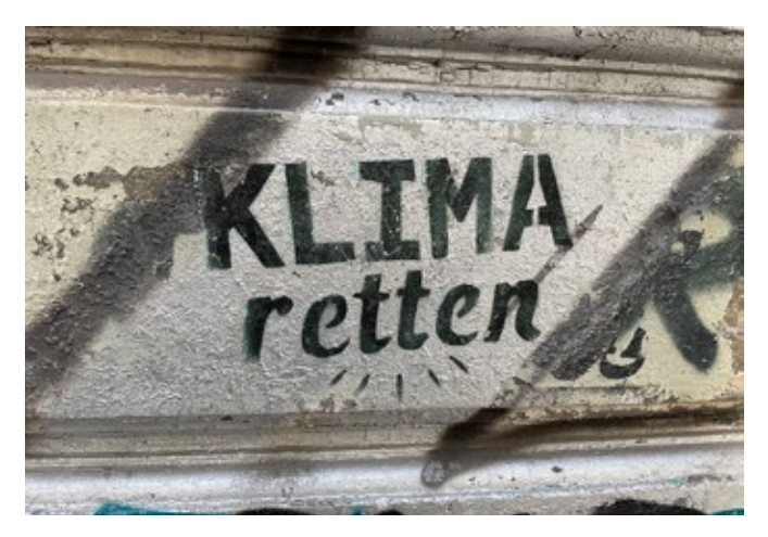
Von Grün-Rot zurzeit auf Eis gelegt

Demo in Rostock +++ Halbzeitbilanz +++ Coronafolgen in der Schule +++ 9-Euro-Ticket +++ Straßenbahn als Alternative +++ Straßenumbenennungen +++ NSU-Komplex in Hamburg +++ Der Reichtumn der Oligarchen +++ 2 Ausstellungen