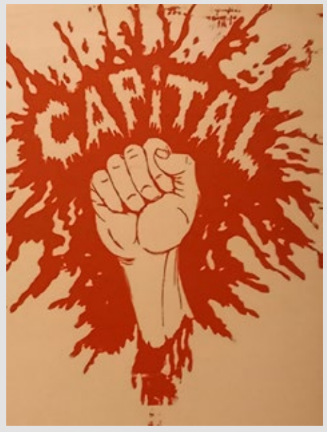
Nicht in der Sammlung, aber ein weiteres Dokument aus den Jahren der Revolte, Plakat aus Frankreich von 1968

Eines der vielen Dokumente auf der Website: Der AStA-Aufruf zur Protestkundgebung gegen den Mord an Benno Ohnesorg vom 7. Juni 1967