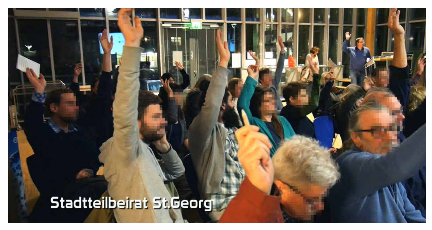
Auf einer Beiratssitzung in Vor-Corona-Zeiten

Im Klartext, die Menschen in St. Georg, die Stimmberechtigten und BesucherInnen des Stadtteilbeirats sollen gefälligst keine Antragsempfehlungen aussprechen, die den Positionen der konservativen Mehrheit in der Bezirksversammlung Hamburg-Mitte widersprechen könnten. Genau so anpasserisch haben sich übrigens regelmäßig die SPD-Mitglieder im Beirat verhalten. Was den Beschlüssen der Deutsch-