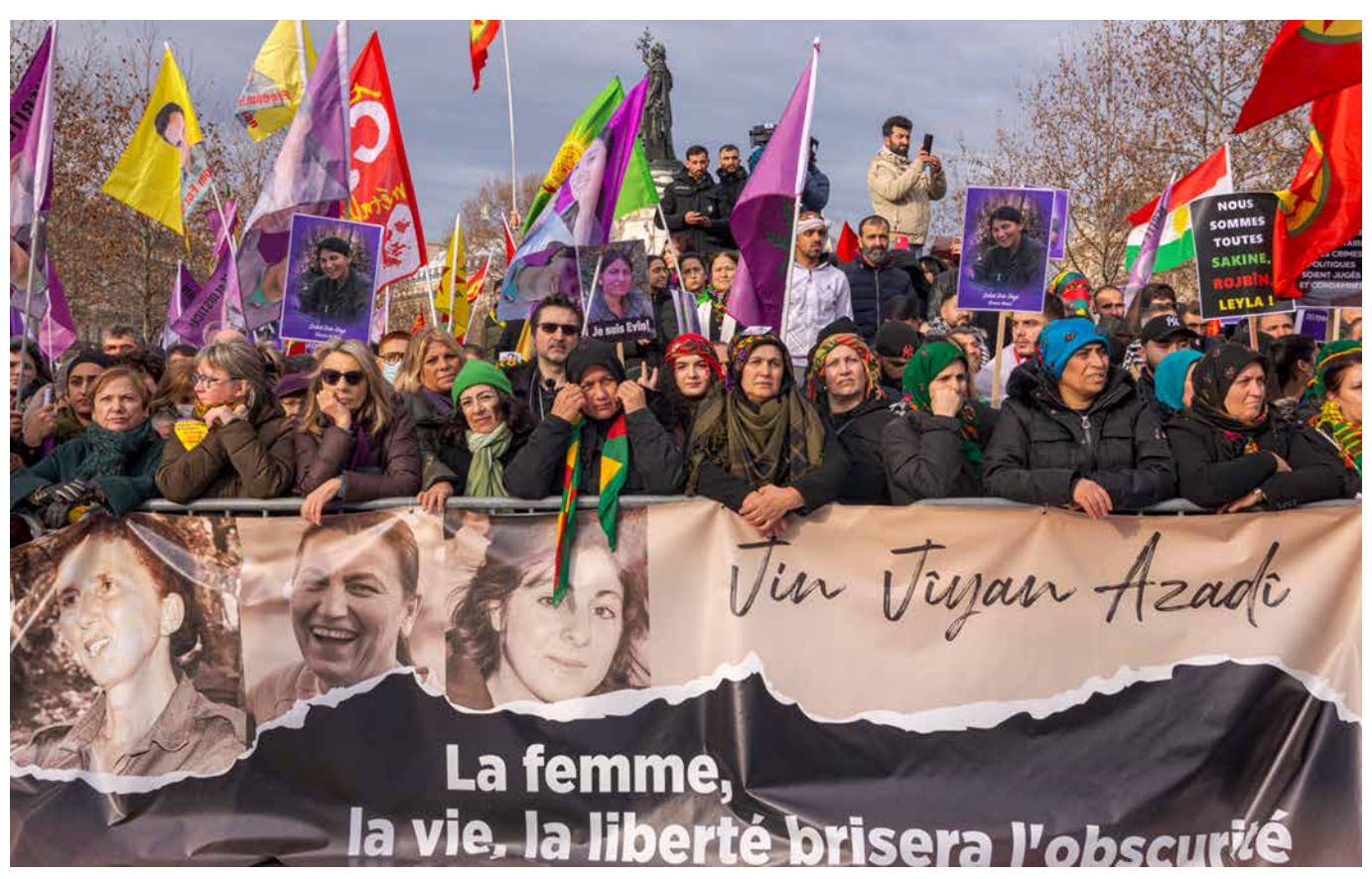
Viele Tausend Menschen demonstrierten am 7. Januar in Paris. Ihr Protest richtete sich gegen den Anschlag vom 23. Dezember und dagegen, dass die Morde an drei kurdischen Aktivistinnen vor zehn Jahren und ihr Hintergrund nicht aufgeklärt wurden

der aus der Türkei geflüchtet ist, Frau und Kind hatte zurücklassen müssen, und der versucht hat, sich hier in Europa ein neues Leben aufzubauen. Tatsächlich ist es nicht das erste Mal, dass es in Paris einen Mordanschlag gab mit mehreren Toten. Am 9. Januar 2013, fast genau zehn Jahre zuvor, wurden drei kurdische Politikerinnen in einem Informationszentrum ermordet. Ein Aktivist hat auf einer Demonstration sehr gut zusammengefasst, was die kurdische Community empfindet: Wir haben gegen den Islamischen Staat gekämpft, damit ihr in Ruhe schlafen könnt – aber ihr konntet nicht mal drei Kurden in Europa schützen.