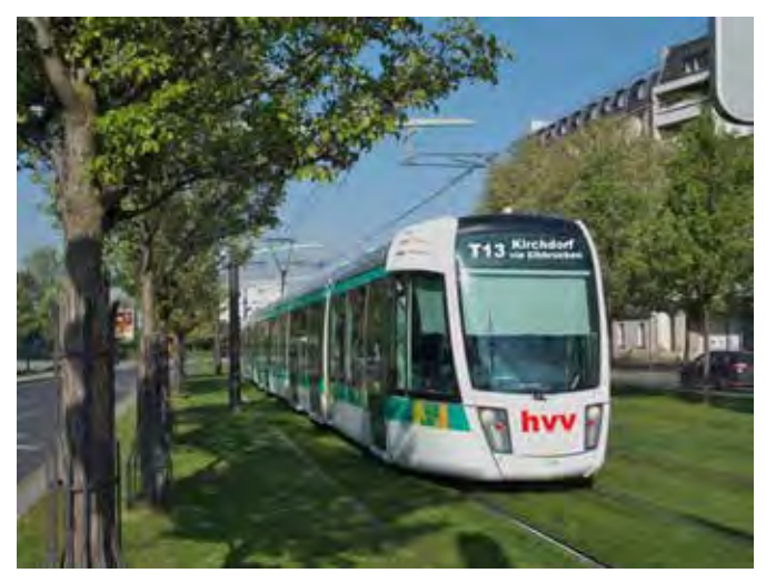
Her mit der Tram!

Überraschende Unterstützung für die Straßenbahn kam übrigens vom Hamburger Klimabeirat. Dieses Gremium, des-