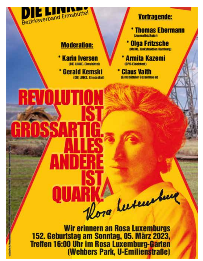
www. die-linke-hamburg. de/aktuelles/termine/detail/rosa-luxemburgs-152-geburtstag

xemburg zwischen 1915 und 1918 aus den Gefängnissen in Wronke und Breslau schrieb, inspirieren« (www.hamburg.de/parkanlagen/3119012/wehbers-park2). Die Kundgebung ist sicher ein guter Anlass, Rosa Luxemburgs zu gedenken und den Garten kennenzulernen.