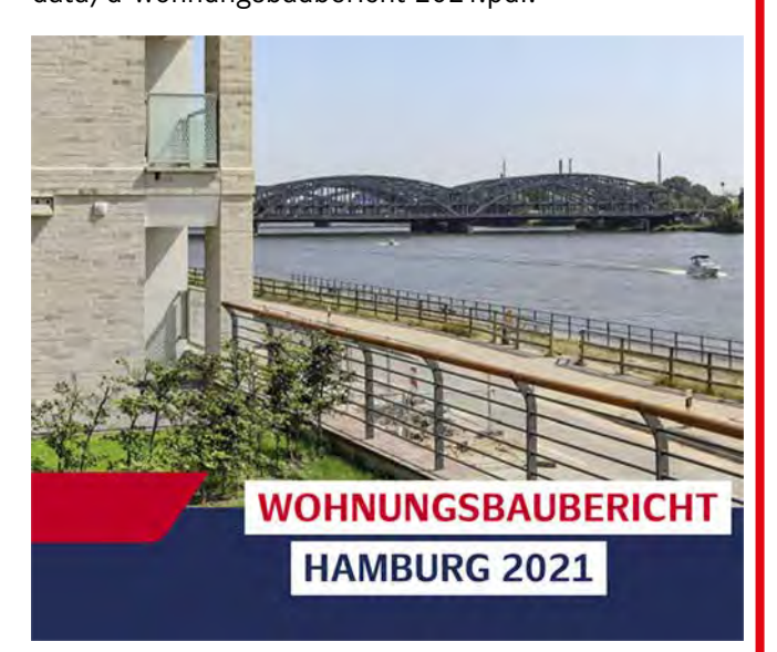
Am 8. Dezember 2022 hatte sich der Stadtentwick- lungsausschuss der Hamburgischen Bürgerschaft den Komplex Baukosten , Lieferengpässe usw. im Wohnungsbau vorgenommen. Die Unterlagen – bestehend aus dem Wortprotokoll der Debatte sowie den Folien eines höchst interessanten Vortrages zu

Vielleicht nicht gerade klammheimlich, doch anders als in den Vorjahren ohne öffentliche Ankündigung ist im November 2022 der neue Wohnungsbaubericht Hamburg 2021 ins Netz gestellt worden. Vielleicht hing dies damit zusammen, dass die Bilanz der kurz danach ausgestiegenen Senatorin Dorothee Stapelfeldt für die letzten ein, zwei Jahre nicht eben positiv war?! Das 36seitige Material präsentiert jedenfalls allerhand wichtige wohnungspolitische Daten mit Stand von Ende 2021 und ist für den entsprechenden Diskurs unverzichtbar: www.hamburg.de/contentblob/16735902/8b045f0654508468f0b02353a82c60ec/data/d-wohnungsbaubericht-2021.pdf.