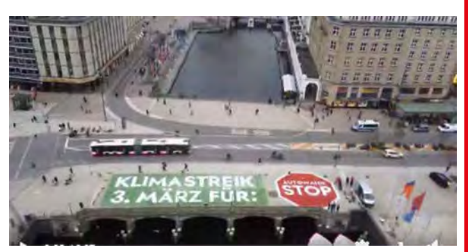
Von der Homepage von Fridays for Future (www.facebook.com/fridays-forfuturehh)

Ein Schwerpunkt wird dieses Mal der Protest gegen 850 Kilometer neuer Autobahnen sein, darunter die Stadtautobahn A26-Ost quer durch Hamburg-Mitte.