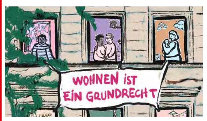
Von der RLS-Homepage www.rosalux.de/news/id/49749/kommunal-bauen-bezahlbar-wohnen

Überhaupt, die Berliner LINKE. Zwei Papiere sollen hier kurz Erwähnung finden. In einer längeren »Nachricht« vom 30. Dezember letzten Jahres hat die Rosa-Luxemburg-Stiftung einige wichtige Aspekte der (Berliner) Stadtentwicklungspolitik zusammengestellt. Kommunal bauen, bezahlbar wohnen, lautet die Maxime. www.rosalux.de/news/id/49749/kommunal-bauen-bezahlbar-wohnen. Die entscheidende Neuorientierung findet sich in dem am 18. Januar vorgelegten kommunalen Wohnungsbauprogramm: »Die Neubauaktivitäten der landesweiten Wohnungsunternehmen (LWU) sollen in einem neuen kommunalen Projektentwickler gebündelt werden, als gemeinsamer Dienstleister der sechs landeseigenen Gesellschaften. Statt einen Anteil von Sozialwohnungen aus Überschüssen aus der Bestandsbewirtschaftung und durch teure frei finanzierte Wohnungen quer zu finanzieren, schaffen wir durch die direkte Zuführung von Eigenkapital künftig ausschließlich bezahlbare Wohnungen im kommunalen Neubau. Dafür stellen wir jährlich bis zu 1 Milliarde Euro bereit und passen die Summe ggf. an die Entwicklung der Baukosten sowie den Neubaubedarf an« (https://dielinke.berlin/kommunales-wohnungsbauprogramm-2023).