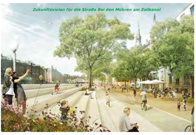
Von der Homepage des Vereins https://www.altstadtfueralle.de/

Der noch junge Verein Altstadt für alle! e.V. lädt für Samstag, den 25. Februar, ein zu einer Zukunftswerkstatt zwecks Entwicklung konkreter Projekte zur nachhaltigen Belebung der Hamburger Innenstadt. Die Veranstaltung findet von 14.00 bis 18.00 Uhr im AIT-ArchitekturSalon (Bei den Mühren 70) statt, die Anmeldung ist zu richten an hamburg@ait-architektur-