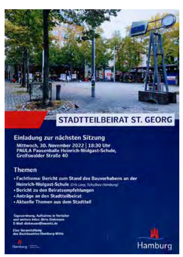
Das Einladungsplakat zur vorerst letzten Stadtteilbeiratssitzung am 30. November 2022