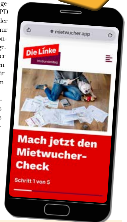
Die Idee für die Mietwucher-App kommt von der Linkspartei. Unter der Internet-Adresse www.mietwucher.app kann man kostenlos checken, ob die Miete eventuell übersteuert ist – und den Hinweis darauf direkt an die zuständige Behörde übermitteln

In Berlin hat das Amtsgericht Tiergarten derweil erstmals ein Gerichtsurteil wegen eines „Verstoßes gegen § 5 des Wirtschaftsstrafgesetzes“ verhängt. Das Gericht stellte fest, dass eine Immobilienfirma die zulässige Miethöhe erheblich überschritten hatte, verhängte ein Bußgeld und verfügte die Rückzahlung des zu viel gezahlten Betrags. Der Fall war über die Mietwucher-App der Linken an das Bezirksamt Friedrichshain-Kreuzberg weitergeleitet worden, das die Klage daraufhin vorantrieb. Aber das wird auch von einer Linken-Politikerin geleitet. Nicht von SPD und Grünen.