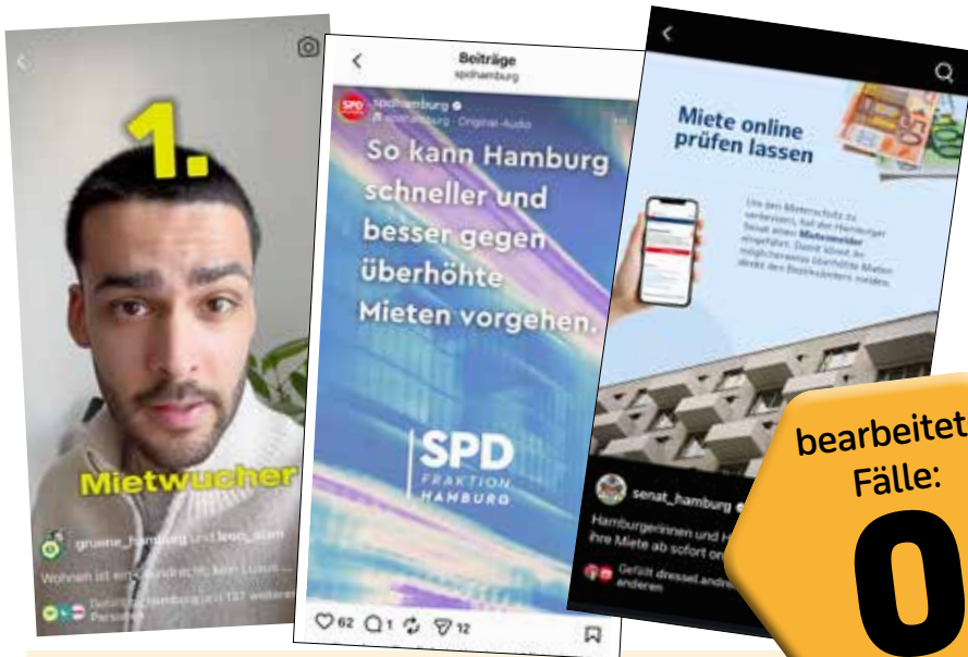
Schnelle, konkrete Hilfe für Menschen mit zu hohen Mieten versprochen Grüne, SPD und Senat auf Social Media vor der Bürgerschaftswahl 2025

Eine Anlaufstelle für Betroffene von Mietwucher versprochen SPD und Grüne im vergangenen Bürgerschaftswahlkampf. Nach über einem Jahr stellt sich heraus: Mehr als Tausend Verdachtsfälle wurden zwar gemeldet. Aber kein einziger bearbeitet