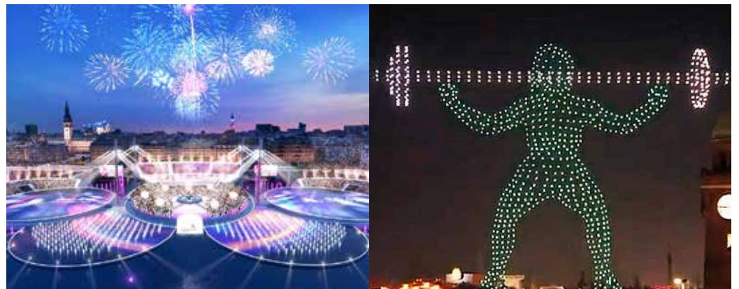
Computervisualisierungen und Drohnenshows sollen in Hamburg Olympia-Stimmung erzeugen – bisher mit wenig Erfolg

Der Hamburger Senat möchte unbedingt Olympia nach Hamburg holen. Und hat eine riesige Werbekampagne dafür losgetreten. Der Slogan: „Eine Chance für alle“. Aber würden die Menschen in Hamburg wirklich von Olympia profitieren?