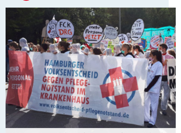
Mehr denn je müssen Klinik-Beschäftigte gegen den Pflegenotstand kämpfen

Dede Katastrophe bringt ihre eigenen Held:innen hervor. Die der Corona-Zeit lenken Busse, stapeln im Supermarkt die Regale voll, pflegen unsere Kranken, unterrichten in viel zu vollen Klassen. Doch der Beifall, der ihnen anfangs von den Balkonen aus gespendet wurde, ist längst verklungen. Ebenso wie die Versprechen, ihnen mehr Geld zu bezahlen. Dabei wäre das schon deshalb wichtig, um den Personalmangel in den Pflegeeinrichtungen und Intensivstationen zu bekämpfen. DIE LINKE meint: Löhne rauf und bessere Arbeitsbedingungen für Corona-Held:innen! Und Hilfszahlungen nur für Betriebe, die ihre Leute vernünftig behandeln und bezahlen!