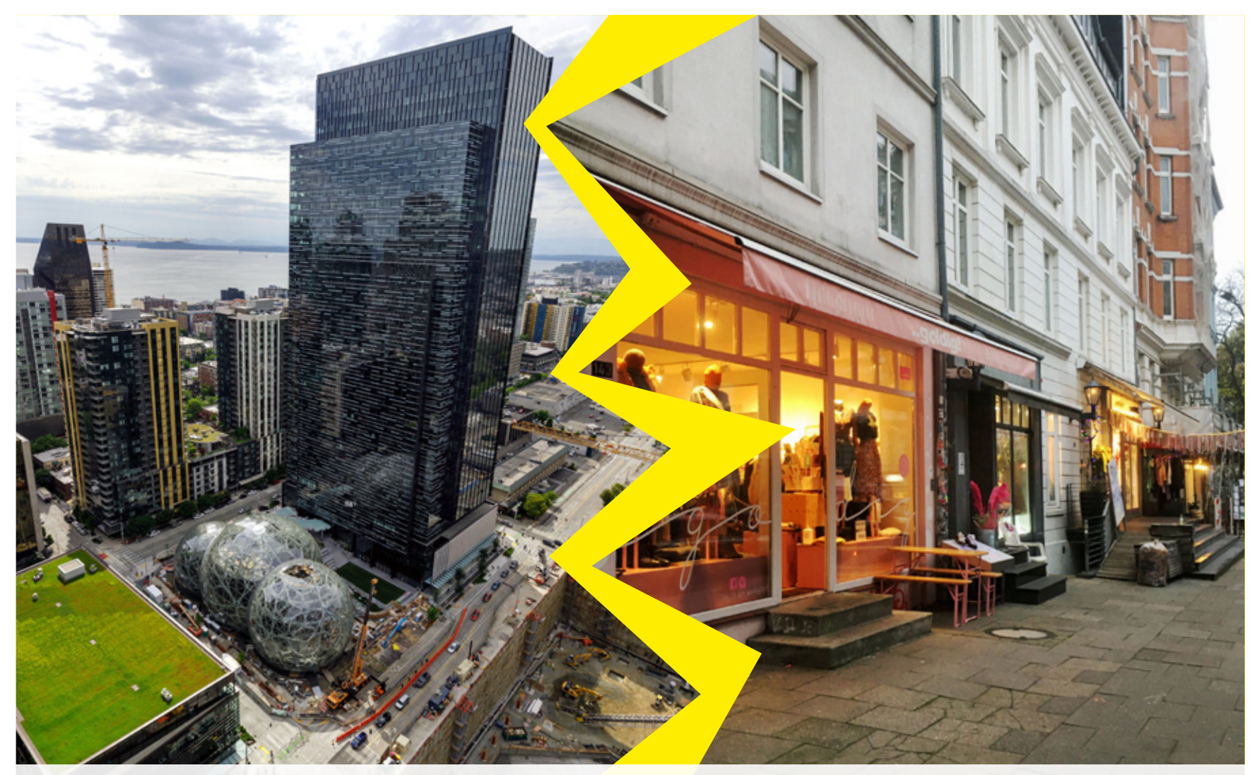
Während man sich in der Amazon-Konzernzentrale in Seattle (links) keine Sorgen um die Zukunft zu machen braucht, kämpfen kleine Läden wie diese im Karolinenviertel (rechts) um ihre Existenz.