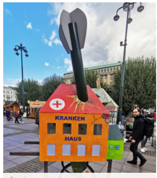
Überall in der Stadt: Aktionen...

Im Hamburger Hafen werden Tag für Tag drei Container voller Waffen und Munition umgeschlagen. Die Initiative "Ziviler Hafen" will diese Exporte ein für allemal stoppen.